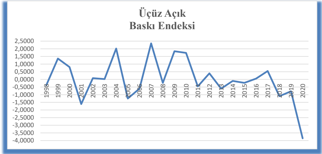
Şekil 2. 1998 – 2020 döneminde Üçüz Açık Baskı Endeksi değişimleri