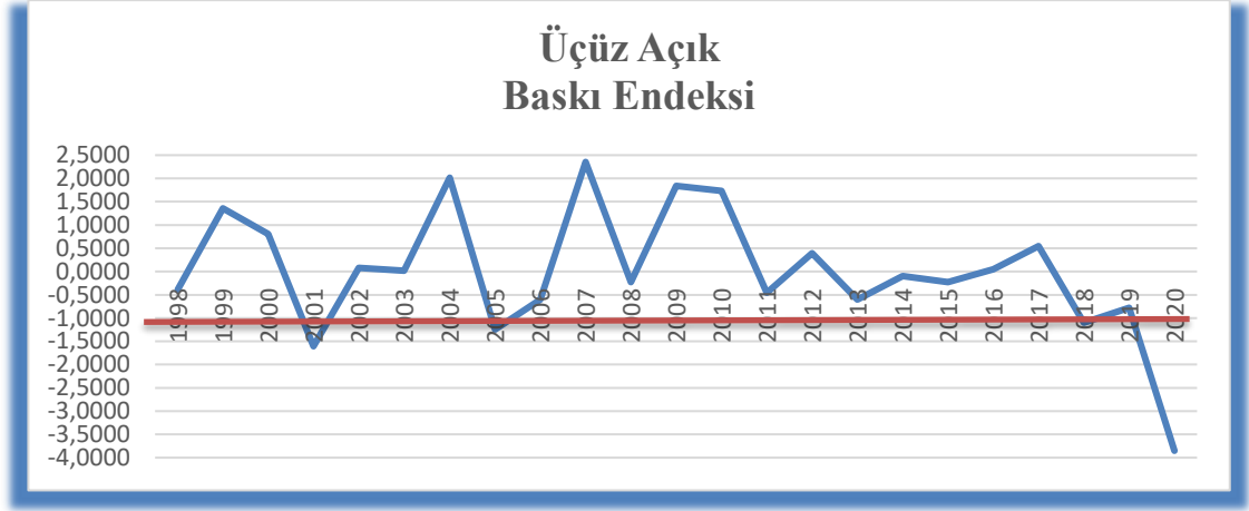
Şekil 3. Üçüz Açık Baskı Endeksi eşik değeri